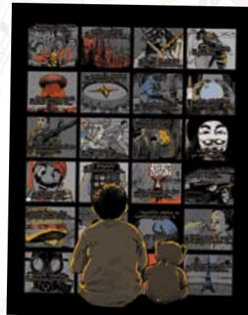
Le Zapping de la Crise, Norédine Allam