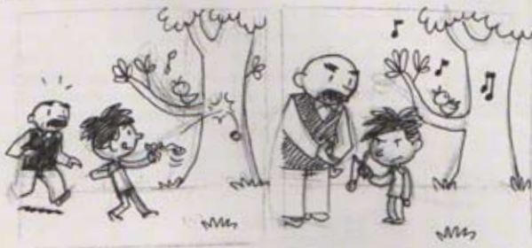
■ Story-board d'Ulf K. © 2014

voudrions présenter dans le musée, à Plauen, avant de le ramener en France puis de le faire tourner. En fait, nous voulons faire vivre ces personnages. Nous ne voulons pas que cette reprise devienne une machine à produire des livres. Vater und Sohn est une énorme boîte de jeu avec laquelle nous n'avons pas fini de jouer. ■