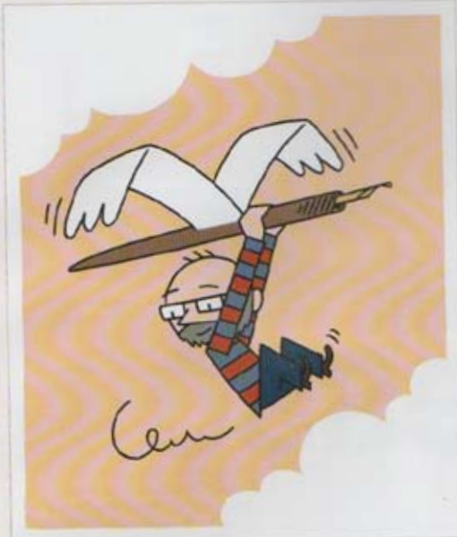
■ Deux autoportraits d'Ulf K. © 2014