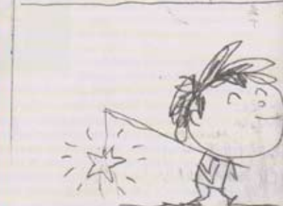
■ Planche d'ouverture des nouvelles aventures de Vater und Sohn signées Marc Lizano et Ulf K. © Lizano & Ulf K. / La Gouttière