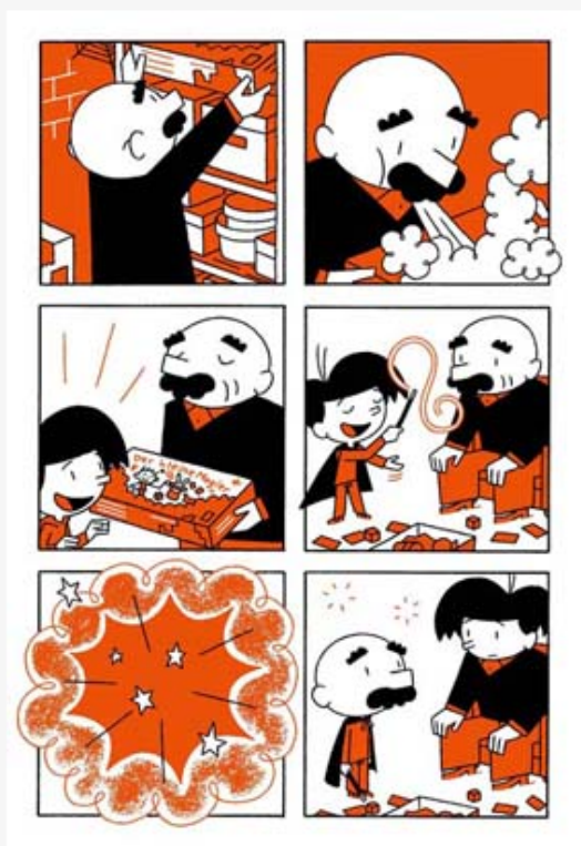
Dessin de Ulf K. © Les éditions de la Gouttière

Les aventures de Vater und Sohn sont particulières : pas de maman, pas de dialogue. Des voyages, de la bêtise et énormément de fessées ! Souvent, le père endosse le rôle de père mais n'est pas dupe. Quand il s'agit de faire des bêtises, il suit son fils et parfois il l'entraîne.