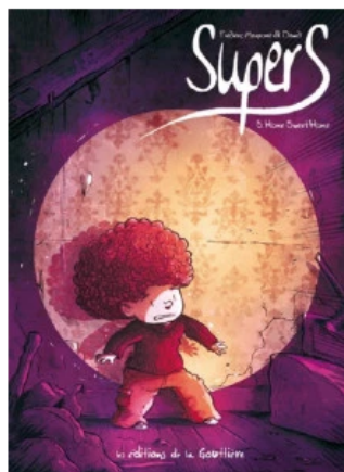
Maupomé – Dawid © La Gouttière – 2017

Les policiers continuent de piétiner dans leur enquête. Mais qui sont donc ces trois supers-héros qui viennent au secours de la veuve et de l'orphelin. D'autant que ces mystérieux alliés leurs ont livré, sur un plateau, un pyromane qui sévissait depuis quelques temps dans la ville. Sauf que lors de son interrogatoire, le pyromane a donné de précieux renseignements sur le profil de des trois super-héros qui l'ont pris la main dans le sac : il s'agit d'enfants.