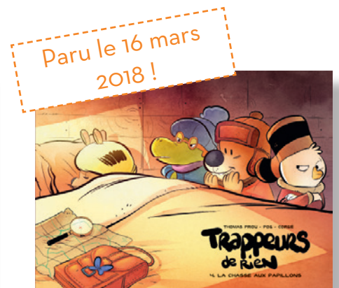
Tome 4 : La Chasse aux papillons

Trappeurs de Rien , série jeunesse dès 5 ans