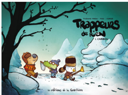
Tome 1 : Caribou