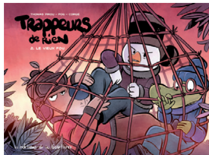
Tome 2 : Le Vieux fou